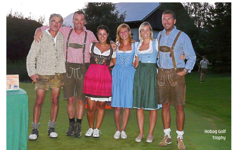
Hobag Golf Trophy