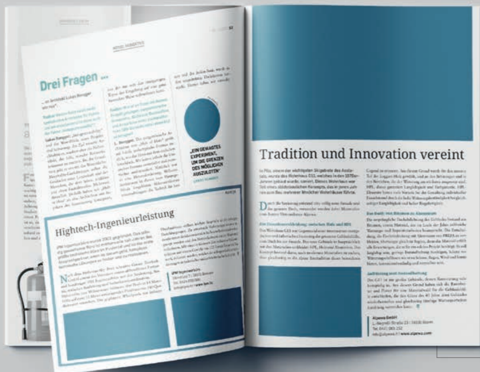
Halbe Seite redaktionell