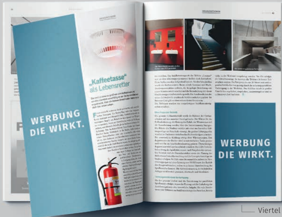
Halbe Seite hoch abfallend